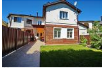
Таунхаус, 223 м 2 Код: 151-851 пл. участка: 3 сот меблирован 21 000 000 руб.