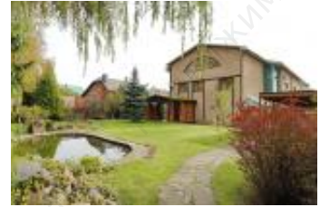
Дом, 1100 м 2 Код: 151-351 пл. участка: 33 сот меблирован 59 000 000 руб.