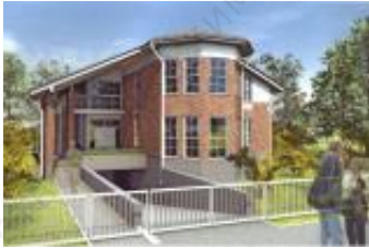
Дом, 452 м 2 Код: 151-321 пл. участка: 10 сот под чистовую отделку 16 000 000 руб.