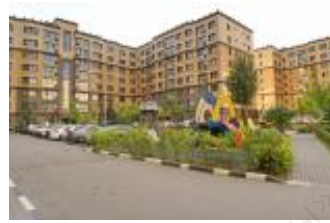
Квартира, 185 м 2 Код: 108-510