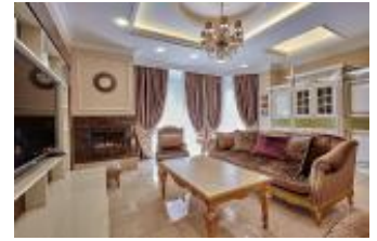
Таунхаус, 192 м 2 Код: 108-253 пл. участка: 1.7 сот меблирован 72 500 000 руб.