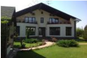
Дом, 436 м 2 Код: 108-831 пл. участка: 17.6 сот под ключ 83 166 390 руб.