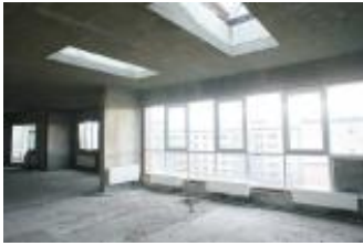
Квартира, 137 м 2 Код: 108-509