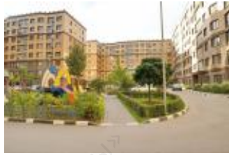
Квартира, 161 м 2 Код: 108-508