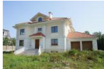
Дом, 807 м 2 Код: 108-838 пл. участка: 51 сот под отделку 161 526 500 руб.