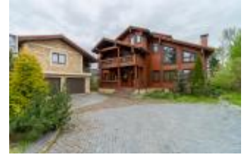
Дом, 843 м 2 Код: 208-943 пл. участка: 15 сот меблирован 59 900 000 руб.