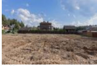
Участок, 30 сот Код: 208-654