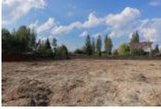
Участок, 15 сот Код: 208-653