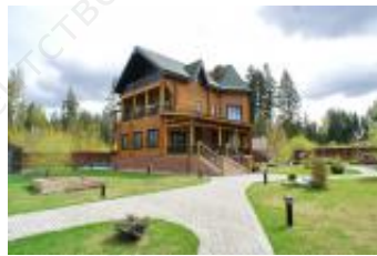
Дом, 700 м 2 Код: 208-429 пл. участка: 95 сот меблирован 120 000 000 руб.