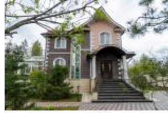
Дом, 337 м 2 Код: 208-942 пл. участка: 15 сот меблирован 35 000 000 руб.